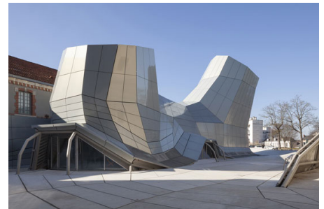
FRAC - Centre-Val de Loire