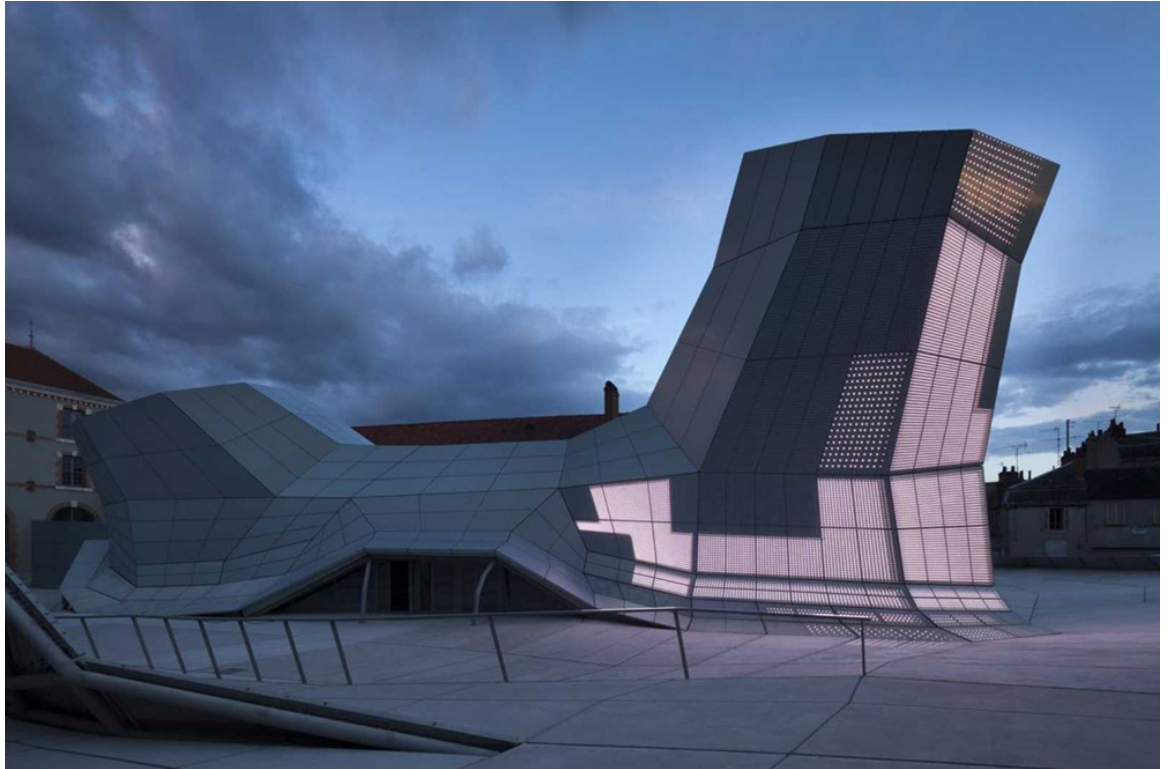
FRAC Centre-Val de Loire