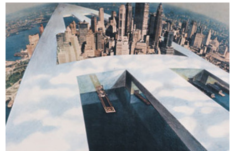
La vie après l'architecture , Superstudio