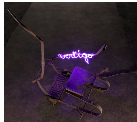
Vertigo , 2015 Photo Fabrice Seixas © ADAGP Claude Lévêque. Courtesy the artist and kamel mennour, Paris