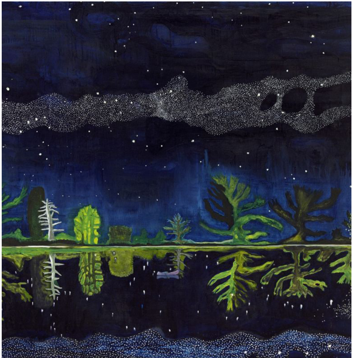
Peter Doig Milky Way 1989-90 Huile sur toile