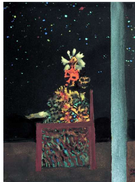
Henri Michaux, Le Prince de la nuit , 1937. © Adagp, Paris, 2017 © Centre Pompidou, MNAM-CCI, Dist. RMN-Grand Palais