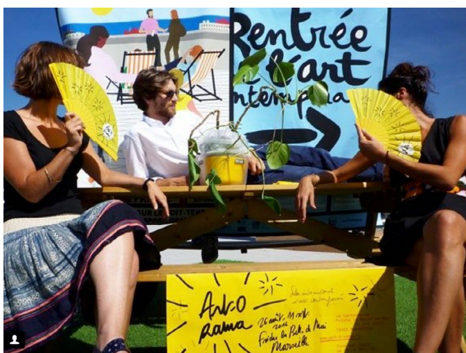
ART-O-RAMA 2017, Marseille

20h30 : dîner officiel d'ouverture de la foire Palais du Pharo