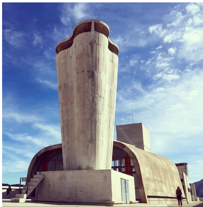
MAMO, Centre d'art de la Cité Radieuse, Marseille