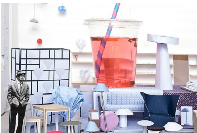
Design Parade 2018, Villa Noailles, Hyères