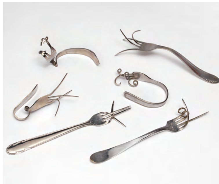
Bruno Munari, Forchette parlanti, 1958

Soit coût réel après défiscalisation : 1936 € individuel / 2071 € couple