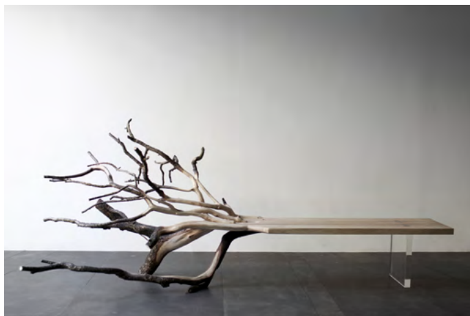
Benjamin Gréindorfe, Fallen Tree, 2011 © Benjamin Gréindorfe et Ymer & Malta