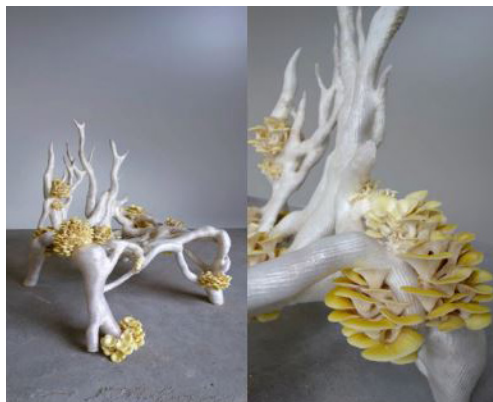
Klarenbeek & Dros, Mycelium Chair , 2018 Don des Amis du Centre Pompidou, Groupe d'Acquisition pour le Design, 2022

... Sans compter une programmation inédite de visites privées d'expositions, d'ateliers d'artistes et de découvertes d'institutions culturelles, en présentiel ou en digital, en France et à l'international, en présence des conservateurs et à laquelle les membres du GAD ont accès toute l'année.