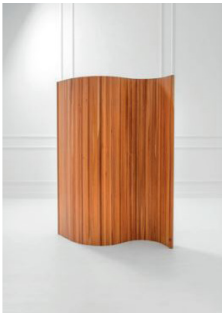
Alvar Aalto, Paravent , 1950 Don des Amis du Centre Pompidou, Groupe d'Acquisition pour le Design, 2019