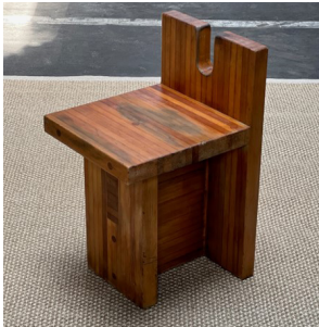
Lina Bo Bardi, SESC-zoo/ , 1980 Don des Amis du Centre Pompidou, Groupe d'Acquisition pour le Design, 2023

Elle prend appui sur des œuvres modernes, devenues des références incontournables (Charlotte Perriand, Eileen Gray, Jean Prouvé) et a été enrichie grâce à des donations de fonds de créateurs tels qu'Ettore Sottsass, Serge Mouille, Ron Arad ou encore Philippe Starck.