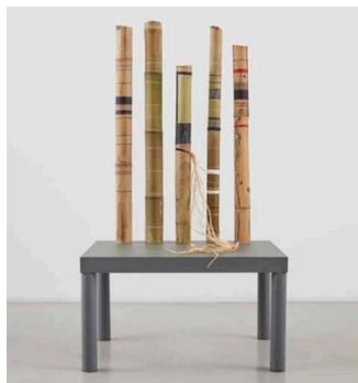
Nanna Ditzel, Bench for two , 1989 Don des Amis du Centre Pompidou, Groupe d'Acquisition pour le Design, 2021