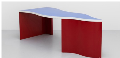
Alessandro Mendini, Bureau Bandiera , 1988 Don des Amis du Centre Pompidou, Groupe d'Acquisition pour le Design, 2023