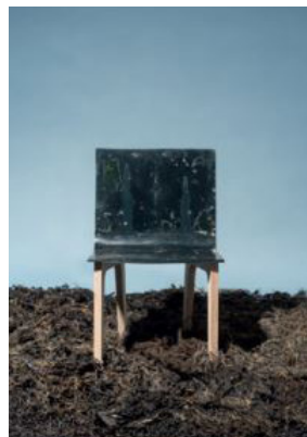
Samuel Tomatis, Série Alga , 2016 Don des Amis du Centre Pompidou, Groupe d'Acquisition pour le Design, 2022